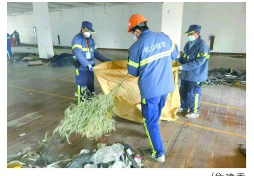
建筑垃圾清运企业争分夺秒清运垃圾