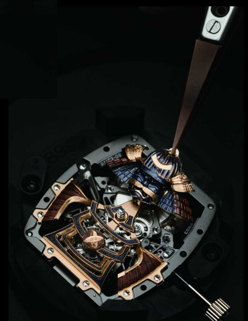
RM 47陀飞轮表工艺细节