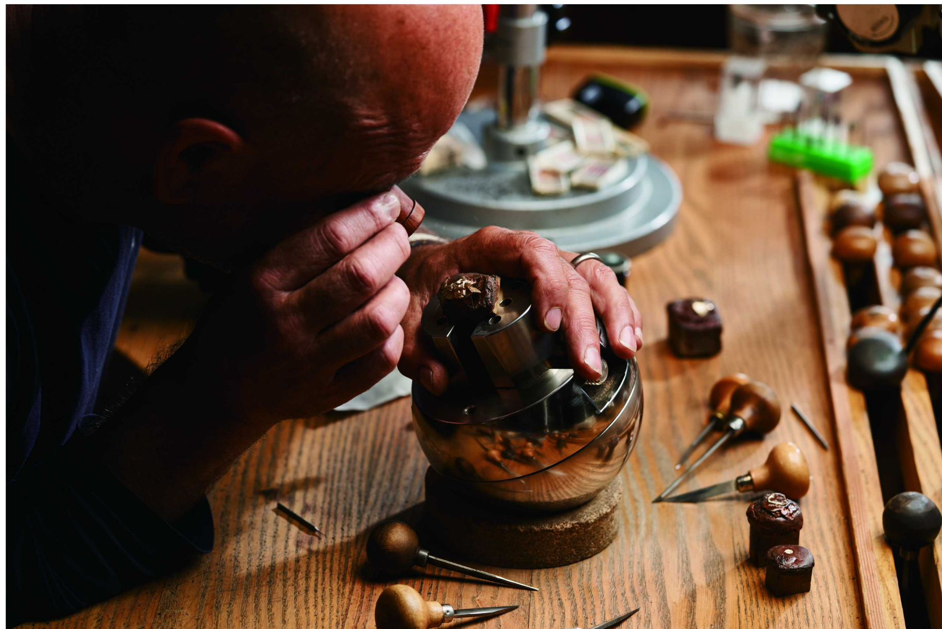
经过16小时以上的精工雕刻和9小时打磨而成的RM 47陀飞轮腕表中盖甲部分