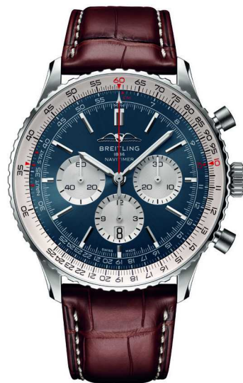
百年灵航空计时 B01 计时腕表