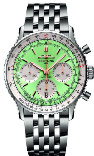
百年灵航空计时 B01 计时腕表

腕表有多种尺寸(46、43、41毫米)、两种表壳材质(精钢和18K红金)以及多款表带(半哑光鳄鱼皮表带或七排式金属表链)可供选择。百年灵以蓝色、绿色、铜色等现代色彩焕新表盘设计。此外，AOPA的羽翼回归到其原来的12点钟位置，也成为引发怀旧的亮点。