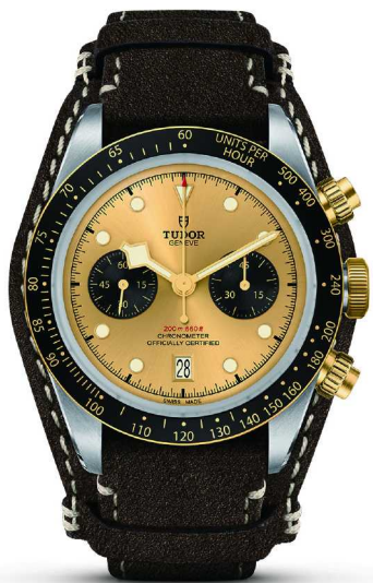
帝舵碧湾计时型黄金钢款

自1970年推出首款计时腕表Oysterdate以来，帝舵表一直致力于研发并制造与赛车运动紧密相关的系列腕表。帝舵表亦不断提升其专业潜水腕表的品质，自1954年持续至今。碧湾计时型黄金钢款腕表秉承两者传统，搭配对比鲜明的副计时盘、性能出众的帝舵表自动上链机芯，并配备导柱轮以及垂直计时离合轮装置，性能卓越，兼具运动气息与时髦风尚。