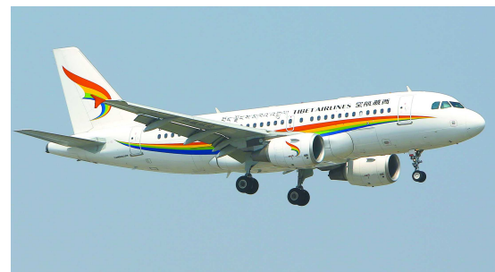
◀B-6425资料图片，交付时该客机没有选装翼梢小翼(WINGLET)，2018年之后加装，用于改善机翼的气动布局，提升升力、节约油耗。