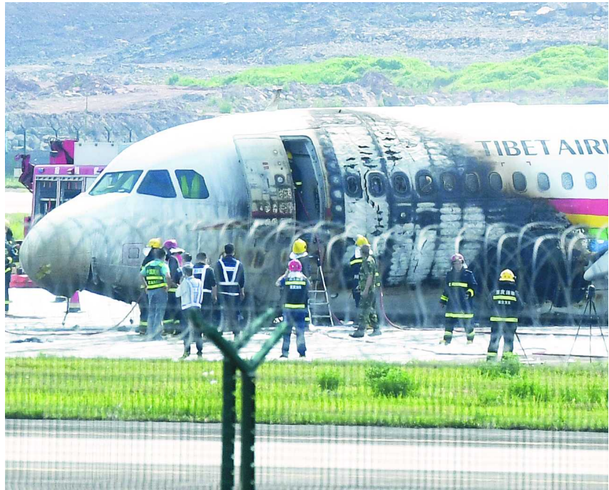
▲飞机左侧起火，机身前部烧灼明显。

目前西藏航空尚未停飞A319机型，不过记者注意到，事件发生后，昨今两天该航司部分成都、重庆至拉萨的航班已取消，取消机型包括空客A319、A330。