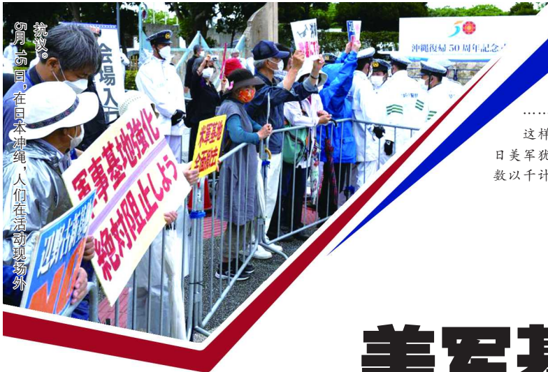
抗议。5月16日，在日本冲绳，人们在活动现场外