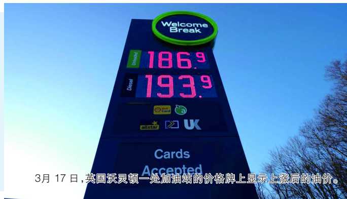
3月17日，英国沃灵顿一处加油站的价格牌上显示上涨后的油价。

由于部分欧盟国家对俄能源依赖度较高，欧盟内部对加码制裁俄能源领域一直存在严重分歧。为照顾部分成员国需求，欧盟委员会提议给捷