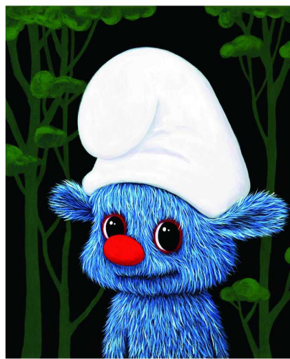
我会一直陪着你（2021年）