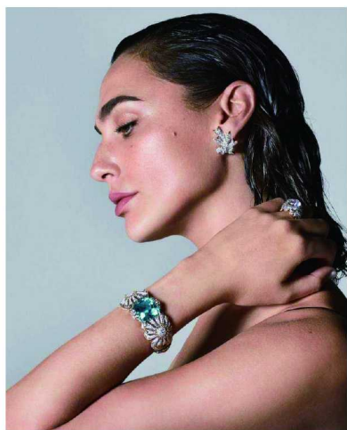
盖尔·加朵佩戴蒂芙尼 2022 Blue Book 高级珠宝系列 BOTÁNICA-Schlumberger 花朵造型手镯、钻石戒指及耳环