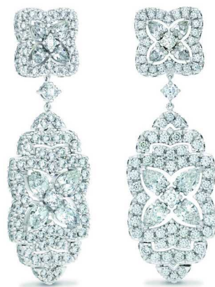
De Beers Jewellers 戴比尔斯珠宝 Enchanted Lotus 水滴形切割钻石耳环

戴比尔斯珠宝于自然中寻迹灵感。Enchanted Lotus 系列再添高级珠宝臻作，延展并诠释纯净莲花的经典设计。全新高级珠宝水滴形切割钻石耳环和钻石戒指在经典形式中融入现代元素，中央的圆形明亮式切割钻石周围环绕水滴形切割钻石，在光线绽放华美光彩。精巧优雅的密镶花瓣层叠错落，传达出莲花光明和纯洁的深刻寓意。