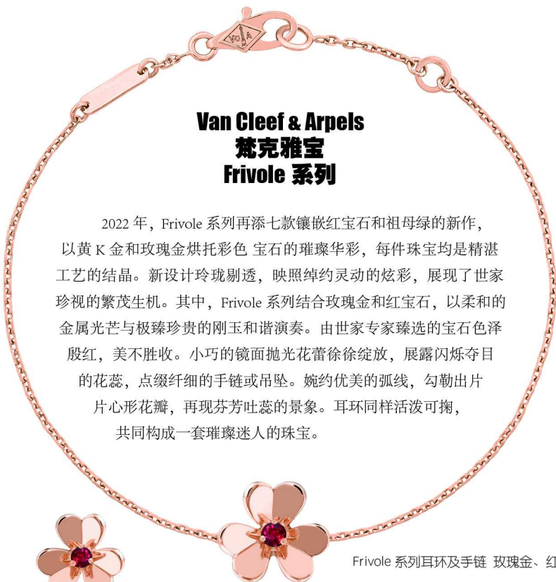
Frivole 系列耳环及手链 玫瑰金、红宝石

2022年，Frivole 系列再添七款镶嵌红宝石和祖母绿的新作，以黄K金和玫瑰金烘托彩色宝石的璀璨华彩，每件珠宝均是精湛工艺的结晶。新设计玲珑剔透，映照绰约灵动的炫彩，展现了世家珍视的繁茂生机。其中，Frivole 系列结合玫瑰金和红宝石，以柔和的金属光芒与极臻珍贵的刚玉和谐演奏。由世家专家臻选的宝石色泽殷红，美不胜收。小巧的镜面抛光花蕾徐徐绽放，展露闪烁夺目的花蕊，点缀纤细的手链或吊坠。婉约优美的弧线，勾勒出片片心形花瓣，再现芬芳吐蕊的景象。耳环同样活泼可掬，共同构成一套璀璨迷人的珠宝。