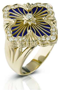
Buccellati 布契拉提 Opera Tulle 系列戒指黄金、钻石、珐琅