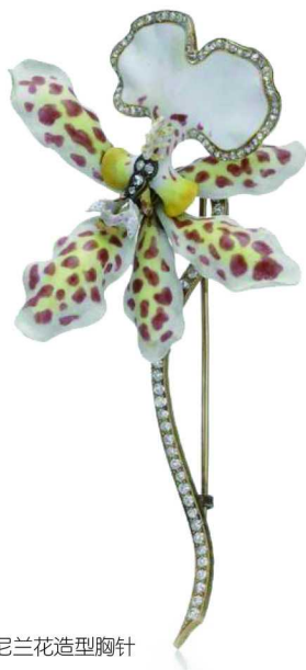
蒂芙尼兰花造型胸针