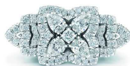
De Beers Jewellers 戴比尔斯珠宝 Enchanted Lotus Cocktail 白金钻石戒指