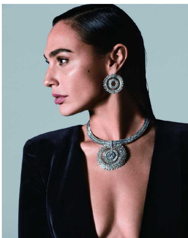
盖尔·加朵佩戴蒂芙尼 2022 Blue Book 高级珠宝系列