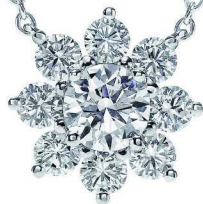
海瑞温斯顿 Sunflower 系列 钻石坠饰