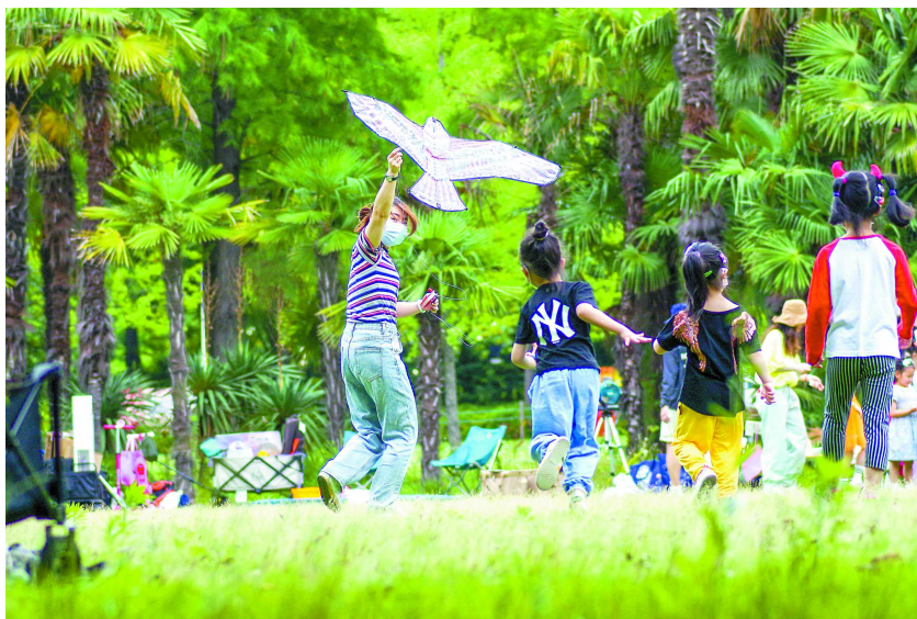
随着上一波降雨结束，本周工作日将以多云天气为主。

好在这波明显降水很快就停了。今天周一工作日，白天没有雨水打扰，多云为主。阳光助力，气温将快速上升，早间最低气温在 21℃ 左右，午后最高气温可升至 31℃ 附近，炎热体感不言而喻。风力不大。西到西南风 3-4