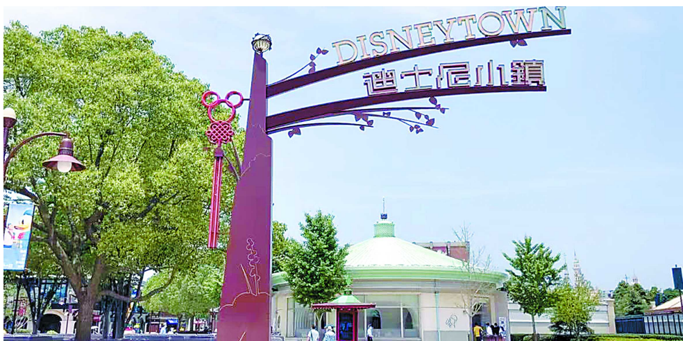
16日,迪士尼小镇及乐园酒店恢复营业首日,一些市民冒着高温前来“打卡”。

16日是上海迪士尼度假区开幕6周年的日子,也是迪士尼小镇及乐园酒店恢复营业首日。受工作日、高温及乐园未开等多种因素影响,迪士尼小镇当天客流平稳。乐园酒店的部分房型抢手,周边民宿重新焕发吸引力。据飞猪旅行统计,迪士尼官宣小镇及乐园酒店恢复营业当日,上海迪士尼度假区飞猪官方旗舰店访问量较前一日快速拉升227%。途家数据显示,6月14日,上海迪士尼乐园周边民宿预订交易额,环比13日增长超1倍。