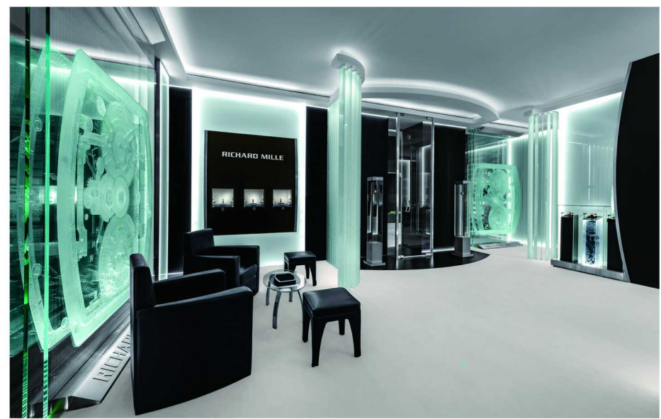
RICHARD MILLE 北京旗舰店

其实，对于 RICHARD MILLE 而言，售出一枚表更是代表着一个“循环”的结束：作为高端的钟表品牌，从人们难以直接体会的内部机芯机械到可以直接观赏到的表壳、表带以及表盒、证书等的一系列附件，最后都聚集于它们的新主人身上。称之为“循环”是因为腕表拥有者在正规的渠道里会被认真地记录在案，随着该表的持有与流传，会一直保留下去。作为传承的起点，RICHARD MILLE 客人本身无论在品牌方面还是圈内都是一种引人注目的存在，有着众多包括生活方式、朋友圈乃至个人品味等无形无形的东西依附其上，这是许多人特别在意的重点。