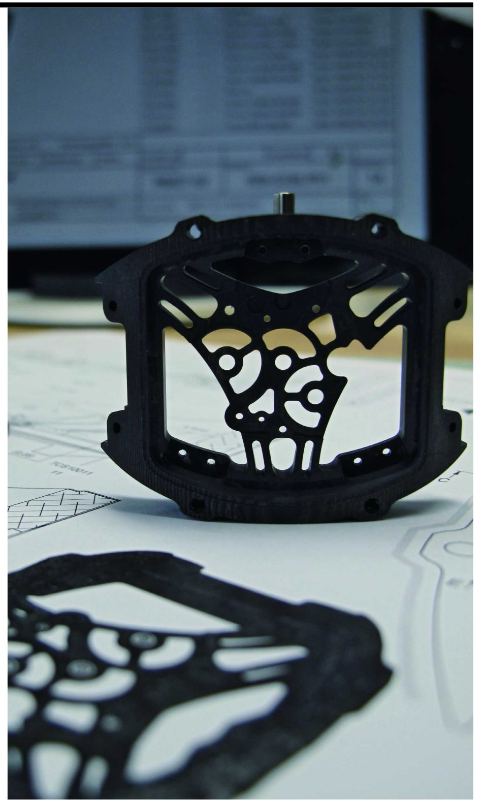
RICHARD MILLE 最具代表性的材质 Carbon TPT ® 碳纤维

总而言之，RICHARD MILLE 遍及全球的精品店里，无论是在北京、上海、香港、新加坡... 总有坚守岗位制表师为客人提供专业的服务，而选择这里是真正负责的经验之谈，也是真正的后顾之忧之选。