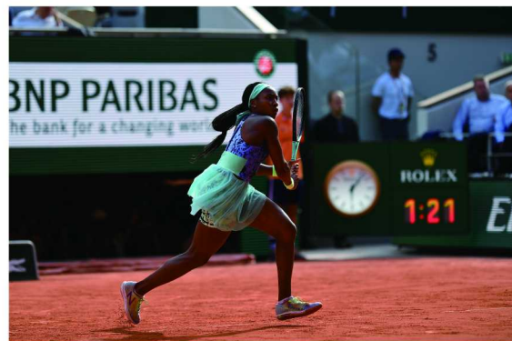
劳力士代言人科里·高芙在2022年罗兰·加洛斯法国网球公开赛