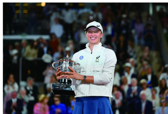
劳力士代言人、2022年罗兰·加洛斯法国网球公开赛冠军伊加·斯维亚特克

2011年，劳力士代言人兼网坛先锋李娜在罗兰·加洛斯球场（Stade Roland-Garros）成功摘冠，成为首位荣获大满贯单打冠军的中国女性，打破了欧美球员对四大满贯单打冠军长达100多年的垄断，成为当之无愧的亚洲网球领