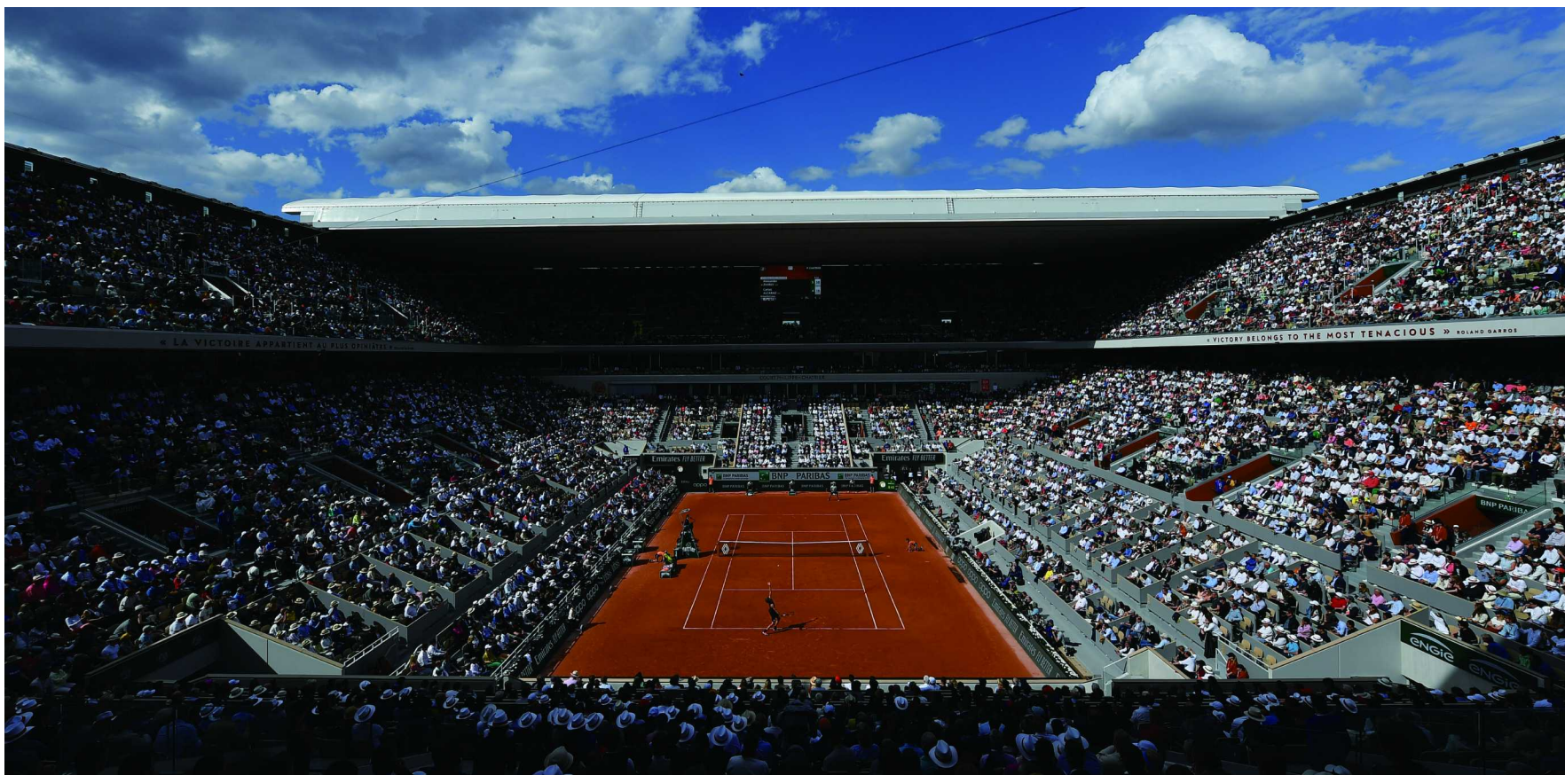
2022年罗兰·加洛斯法国网球公开赛菲利普·沙特里耶球场