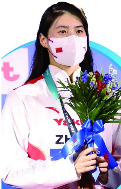
制图/张继

张雨霏回忆2017年至2019年间,自身状态起伏很大,很容易超常发挥,但成绩也不稳定。“从2020年进入世界第一梯队后,我一直保持世界前列,现在我有经验,知道不断改善调整训练,保持稳定,争取让运动生涯更长久。”