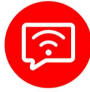
其他具有收发 信息功能的设备、 录放设备