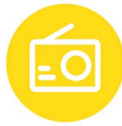
收音机 (7月8日下午使用)