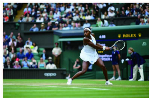
劳力士代言人科里·高芙于2021年温布尔登网球锦标赛