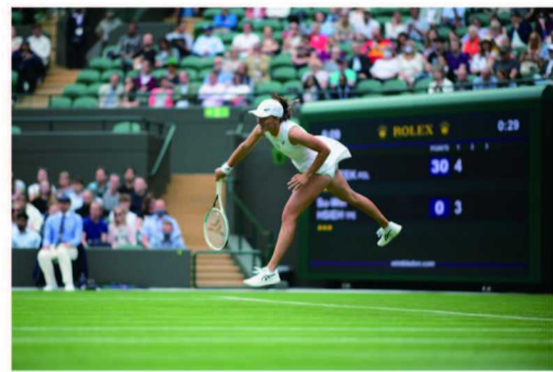
劳力士代言人伊加·斯维亚特克于2021年温布尔登网球锦标赛上发球