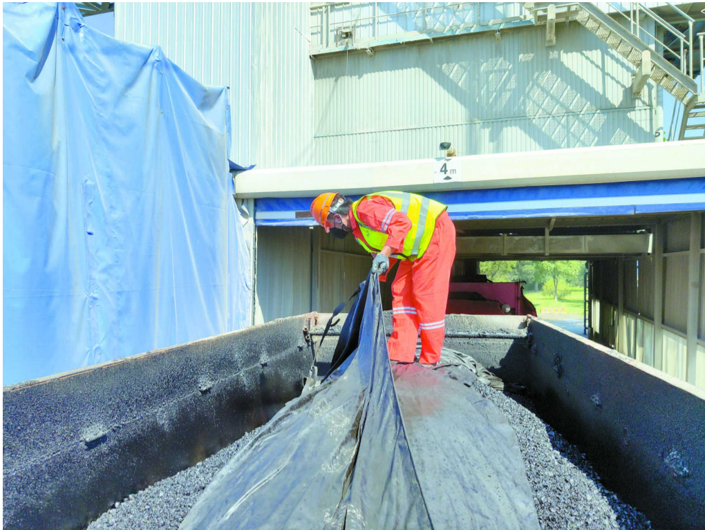
工人在为沥青混合料“盖被”