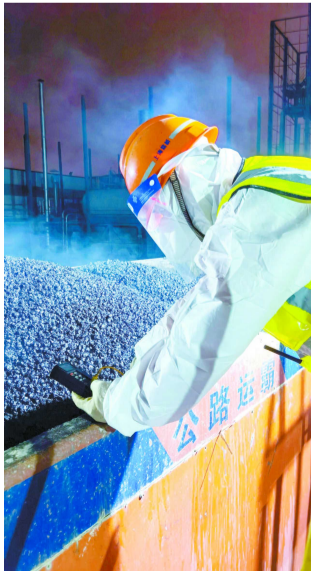
工作人员在进行沥青混凝土测温

目前，为了把因疫情失去的时间“抢”回来，沥青厂站正忙得不亦乐乎。在常态化疫情防控和安全生产两手抓的同时，他们持续加快生产进度，奋战高温，用坚守诠释敬业的“温度”，用汗水赋能城市迭代更新。