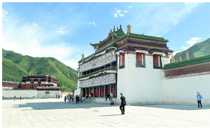
甘南拉卜楞寺美景