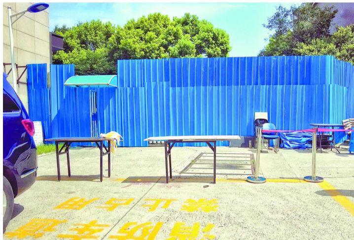
止居民靠近。被封的边门内侧，摆放着桌子、拉起了隔离带，防

居委书记表示，关于小区北门何时开放，需要根据核酸大筛情况而定，“从如今的一周三四次检测降低到一周一次大筛，才会考虑开放北门”。