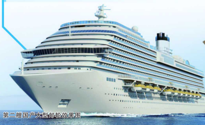
第二艘国产大型邮轮效果图

船上配置高达 16 层庞大上层建筑生活娱乐区域,设有大型演艺中心、大型餐厅、特色餐馆、酒吧、咖啡馆、购物广场、SPA、水上乐园等休闲娱乐设施,满足乘客的生活和娱乐需求。