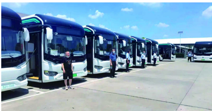
驾驶员在申沃公司提新车