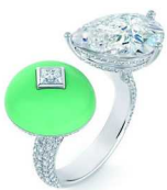
戴比尔斯 The Alchemist of Light 高级珠宝 Midnight Aura 开放式钻石戒指