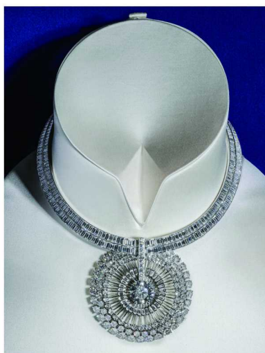
Tiffany &amp; Co. 蒂芙尼 蒲公英项链，多用途佩戴作品

自 19 世纪开始，蒂芙尼便以善于探索 and 发现新品种宝石而闻名，其中紫锂辉石、摩根石、坦桑石、沙弗莱石及蒙大拿蓝宝石更有“蒂芙尼传奇宝石”之称。此次品牌独辟“珍宝阁”，呈现包含红钻、绿钻、蓝钻、粉钻、哥伦比亚祖母绿在内的 37 颗珍罕彩色钻石和宝石，以非凡数量与缤纷色彩，带来一场珍宝盛宴。