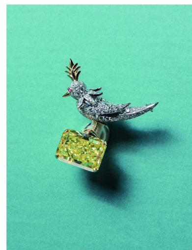
Tiffany &amp; Co. 蒂芙尼 铂金及 18K 黄金镶嵌黄钻“石上鸟”胸针