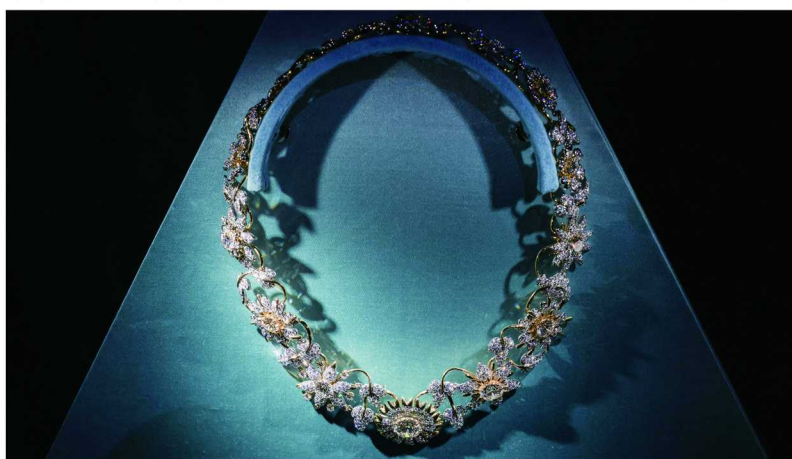
Tiffany &amp; Co. 蒂芙尼 铂金及 18K 黄金镶嵌圆形明亮式钻石花叶造型项链