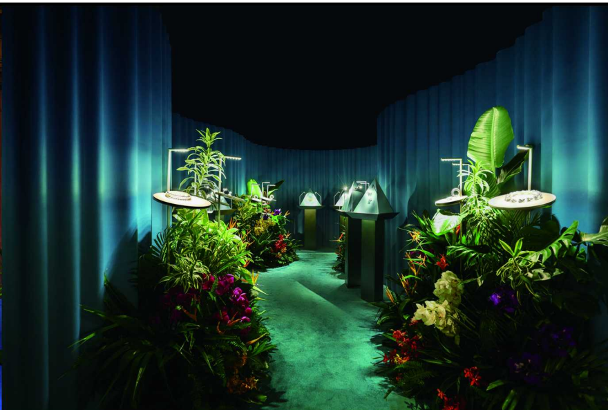
Tiffany &amp; Co. 蒂芙尼“让·史隆伯杰自然灵感”展区