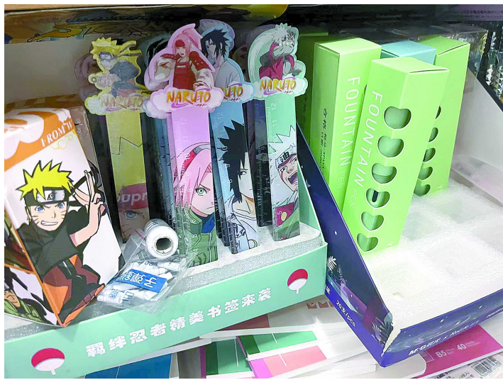
文具店内十元左右的「盲盒笔」