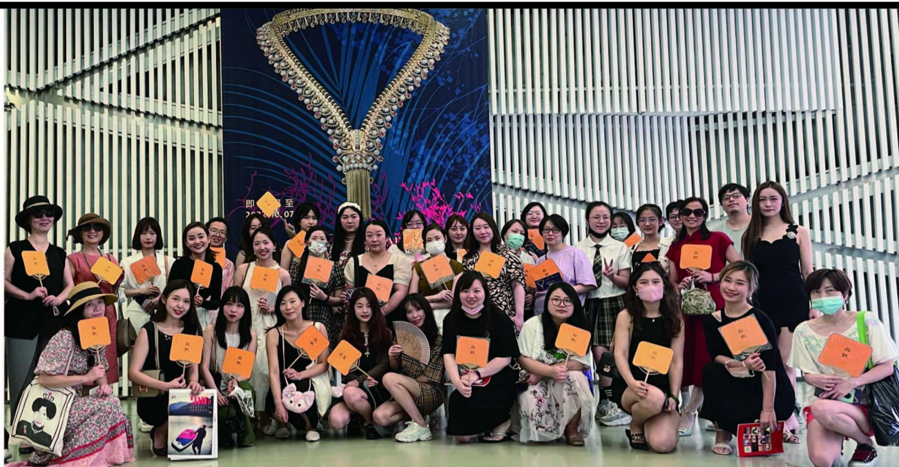
品致俱乐部读者合影

8月25日，新闻晨报·品致周刊和 Van Cleef & Arpels 梵克雅宝携手共同举办的《Van Cleef & Arpels 梵克雅宝：时间、自然、爱》品致俱乐部读者活动，在黄浦江畔工业感十足的上海当代艺术博物馆（Power Station of Art）圆满举办。新闻晨报·品致周刊特别邀请了数十位忠实读者和嘉宾一同体验和见证了这场沉浸式的艺术盛宴。来宾们在精美绝伦的展厅内驻足观赏、打卡留影，并对整场活动赞不绝口。