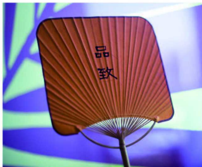
品致俱乐部读者礼品