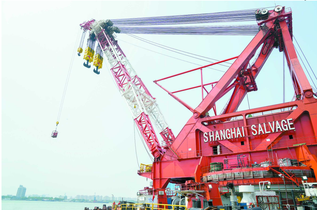
长江口二号古船整体打捞迁移工程主作业船——“大力号”