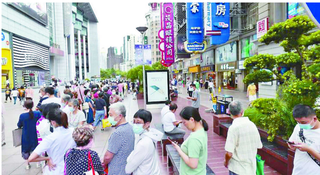
南京路步行街上购买月饼的队伍一眼望不到头