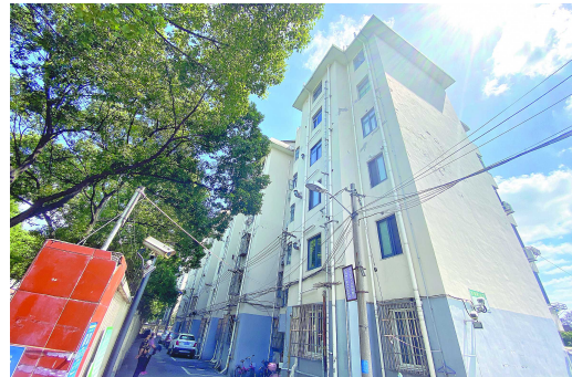
程先生一家住了27年的自住房就在这栋楼里

程先生的产权证成了个一筹莫展的难题。不过,新闻晨报·周到帮办记者介入后,塘镇人民政府表示,将在下周去查找档案以及结算清单等历史资料,核实信息之后,再进行证明盖章等后续流程。