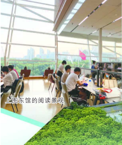
上图东馆的阅读景观