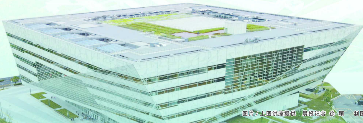
图片/上图讲座提供 晨报记者 徐颖 制图/潘文健