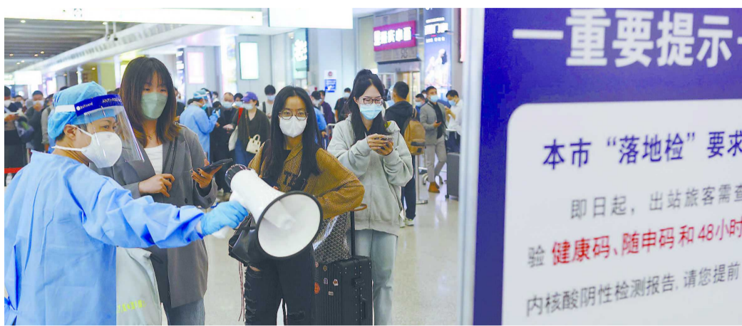
工作人员在铁路上海虹桥站提示抵达旅客做好“落地检”

三是做好核酸检测服务保障。一方面，按照国家和本市有关规定，组织调配力量下沉基层，对本区的高中低风险区开展相应频次的核酸筛查工作，做到“不漏一户、不落一人”。另一方面，做好市民群众节后上班的常态化核酸检测服务，我区共设置常态化采样点893个，将通过采取优化点位布局、延长采样时间、减少排队等候时间等措施，更好满足市民群众就近就便的核酸检测服务需求。