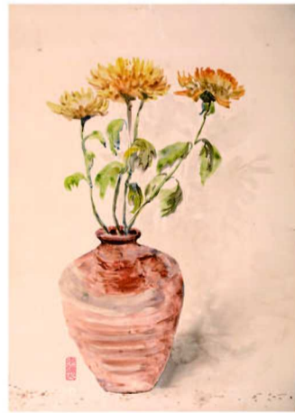
李铁夫《瓶花》(水彩或纸本 20世纪40年代)