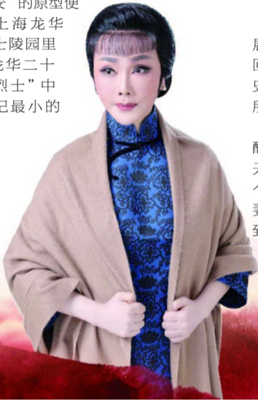
制图 / 潘文健