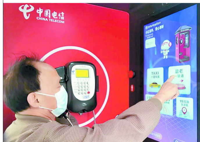
市民正在数字公话亭内尝试使用“助老一键通”