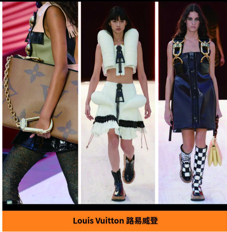
Louis Vuitton 路易威登