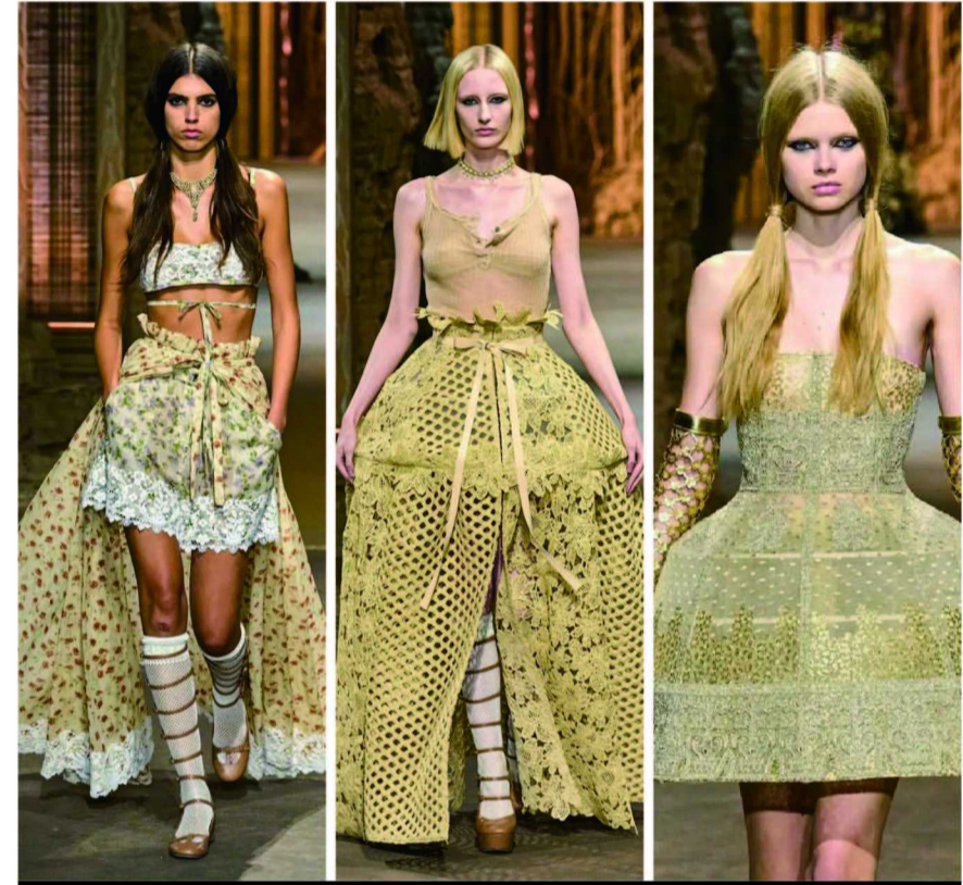
Christian Dior 迪奥