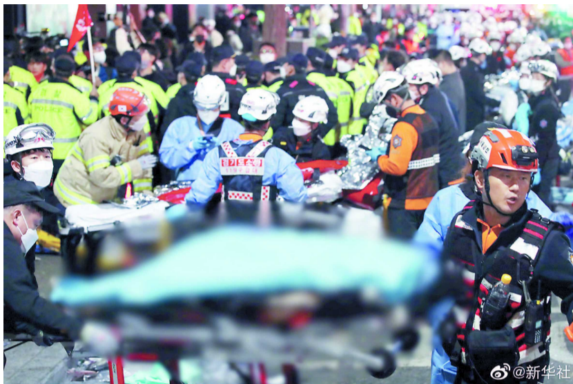
30日凌晨,在韩国首尔市龙山区梨泰院洞一带,救护人员在现场工作。

“在这条狭窄的下坡路上,事故刚发生时,坡路下面一段有人跌倒,但后面的人全然不知,依然推着前面的人往前走……”一名亲历者在社交平台上这样描述当晚踩踏事故现场