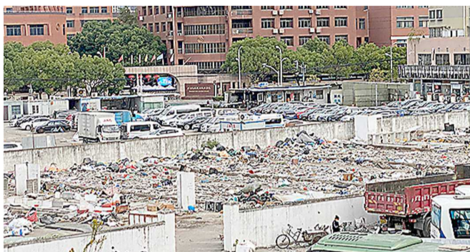
各类垃圾堆满了空地

10月31日,记者就此事联系了龙华街道。街道立即会同相关部门开展联合整治等工作,目前,该废品回收企业已停止经营活动。