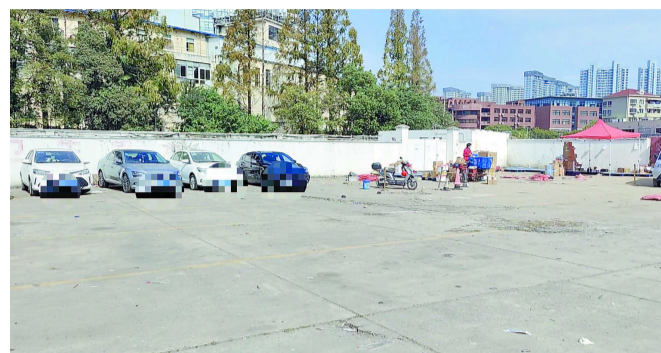
整治后的废品收购站场地