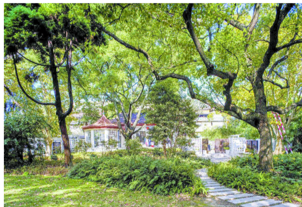
复兴岛公园秋日美景令人陶醉