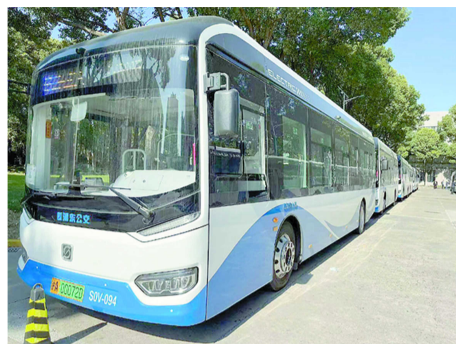
新能源车上线运营