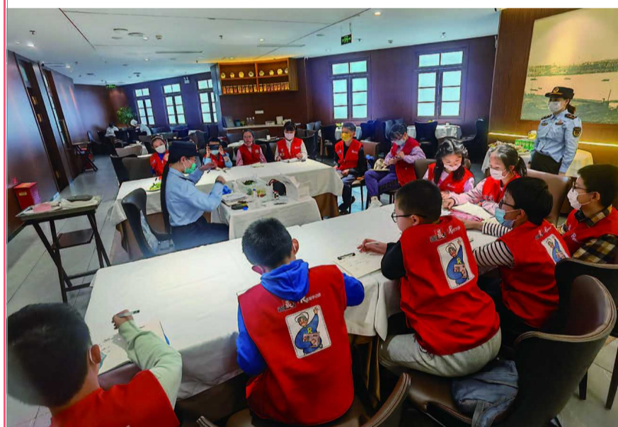
小记者们跟随市场监管员走进餐厅后厨,了解食物安全检测知识。