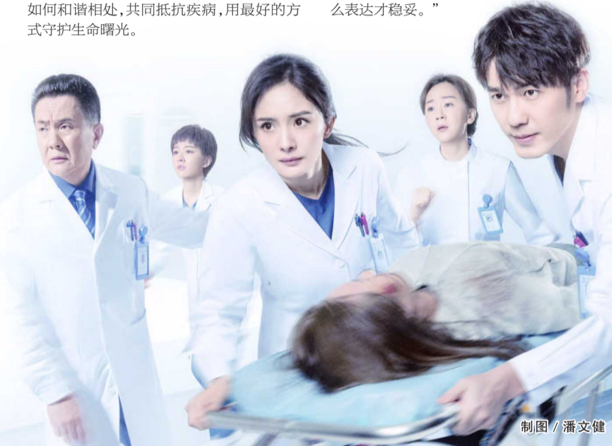
制图 / 潘文健

对此，扮演女主角肖砚的杨幂认为，《谢谢你医生》不是单纯讲医术、说救人，更多地还是讨论情感关怀。通过不同案例，观众可以从中看到医患关系，也能看到病人和家属之间的故事，连她自己也对医生的工作有了新的认识，“拍了这部剧才知道医生要了解医学更要了解人学，因为医生除了要考虑病怎么治，还要考虑怎么跟病患、家属沟通，怎么表达才稳妥。”