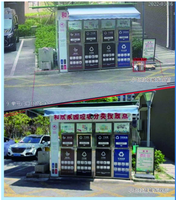
小包垃圾被发现前

普陀区真如镇针对非定时时段乱扔小包垃圾的问题，除了各居民区因地制宜采取增设午间投放时段、延长开放时间等方式满足居民投放需求外，对在所有敞开放式垃圾箱房安装卷帘门，实施封闭管理，安装智能监控170余个，所有视频信号全部接入