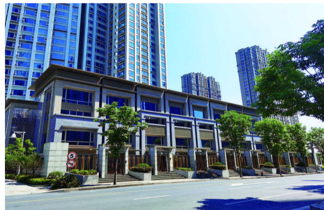
高·尚领域礼泉路特色沿街商铺实景图

事实上,从2013年首次面市至今,经过对多种产品,数轮面市不断迭代更新的普陀真如明星项目——高·尚领域,推出的住宅部分“领寓”一直持续热销,据了解,目前仅余少量首层复式特色户型产品在售,该特色户型可连接室外绿化,为那些对于市中心居住且希望拥有生态园景的购房者带来了全新感受,此外,首层复式设有地下部分,地上建面约