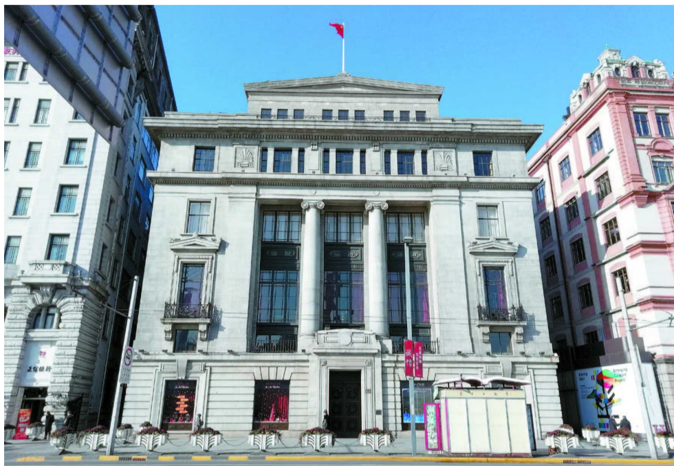
外滩 18 号建筑外观