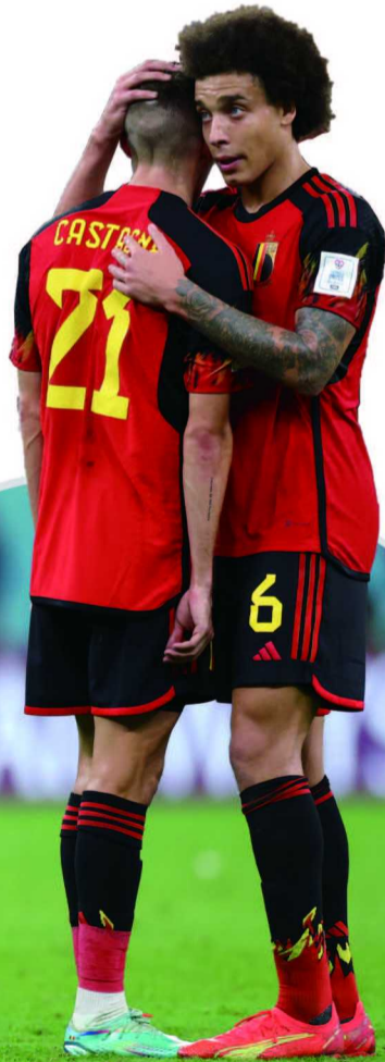
制图/张继

2018年俄罗斯世界杯率领比利时队获得季军的马丁内斯如果真的能够成为海港队下赛季新帅的话,那么他将是第三位在中超执教的世界杯三甲主帅。前两位是广州队的里皮(2006年冠军意大利队)和斯科拉里(2002年冠军巴西队)。