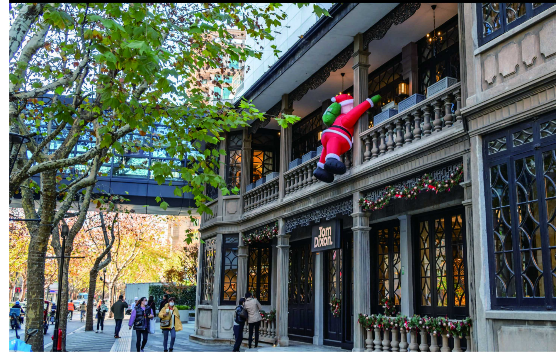
2021年12月23日，上海，黄浦区新天地和淮海中路街头节日气氛浓。