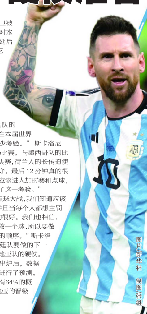
制图:张继

在世界杯四强出炉后,数据机构对首场半决赛进行了预测。结果显示,阿根廷有64%的概率晋级决赛,克罗地亚的晋级概率为36%。