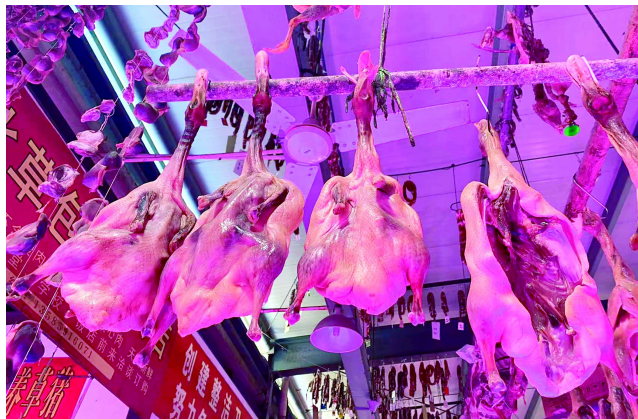
菜场里挂满了腊味