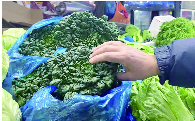
塌菜是白菜的一个变种，叶色浓绿、肥嫩，因塌地生长而得名。