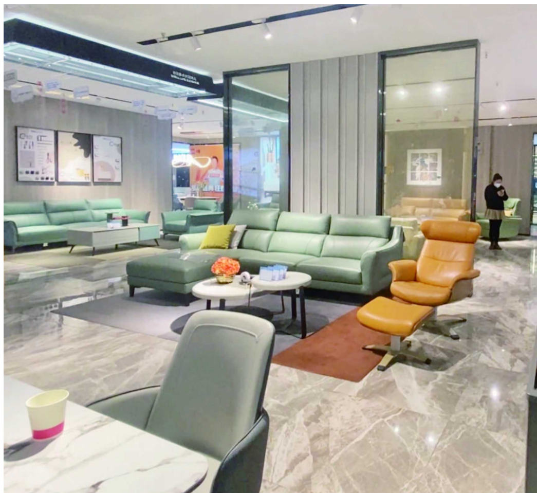
顾家家居东明家具店