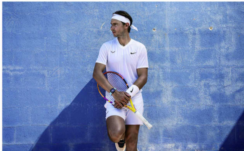
RM 27-04 Rafael Nadal 陀飞轮腕表须臾不离他纳达尔的手腕

同品牌挚友一样，RICHARD MILLE 在 2022 年的发展路程也似乎进入了自己的“心流”状态。这个品牌并没有跟随市场的趋势、众人的潮流观念而发展，只是专注在自己的领域中，继续将创新材质打造出更具品牌特色、执着于打造充满自己个性的腕表作品，以及突破腕表的各种如厚度等的极限。