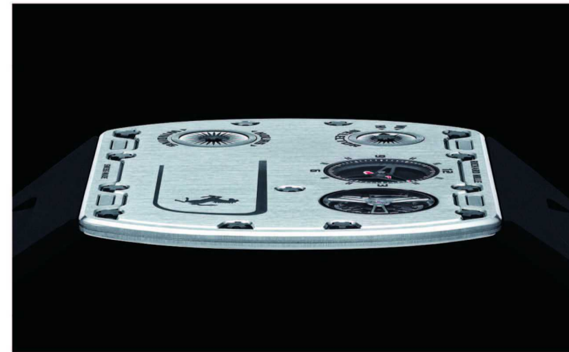
厚度为 1.75 毫米的 RM UP-01 Ferrari 超薄腕表