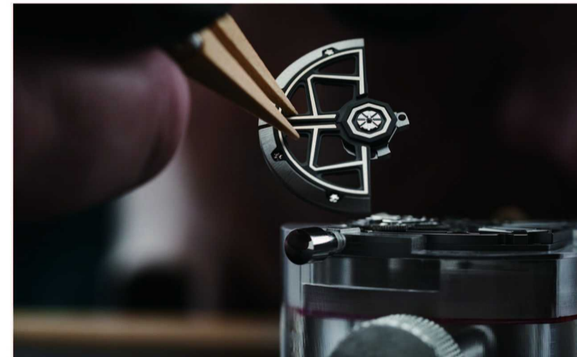
RM 35-03 Rafael Nadal 自动上链表上的专利蝶形摆陀结构

蝶形摆陀以两个五级钛合金摆陀臂构成，并装有重金属制成的砝码，由一个独立齿轮系统驱动，通过专门的按钮启动。在其初始位置，砝码会使得重心向边缘的径向位移，将佩戴者的一举一动转化为上链所需的扭矩。而在按下 7 点位的按钮时，齿轮