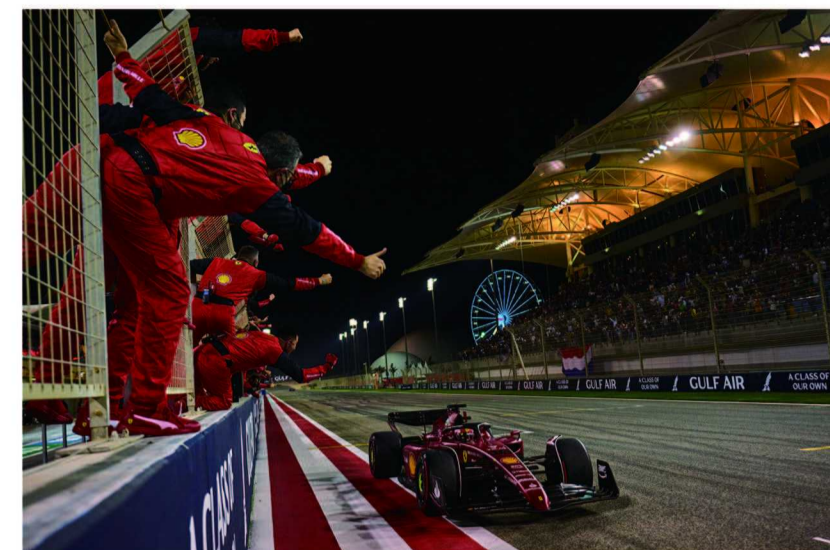
品牌合作伙伴法拉利 F1 车队