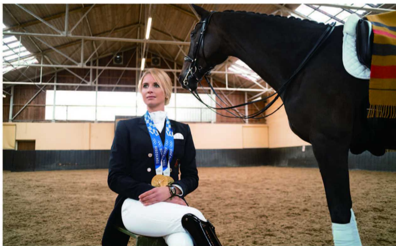
品牌挚友杰西卡·冯·布雷多-韦恩德尔 (Jessica von Bredow-Werndl)