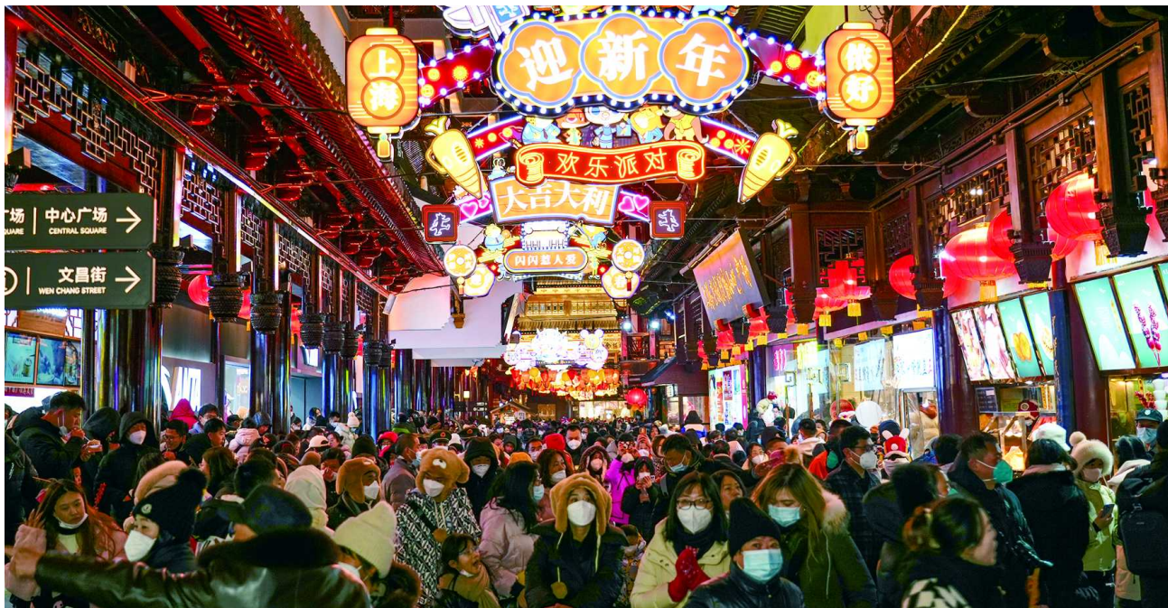
农历正月初三,市民游览“山海奇豫记”新春上海豫园灯会。

消费,消费,还是消费!吃喝玩乐,春节返乡与节后外出游玩的流动热潮不断高涨,各个平台的消费都出现了爆发性的增长。