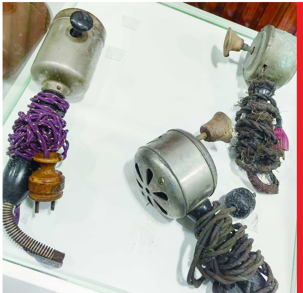
民国时期上海人民就在用的筋膜枪

这种穿越感,当然不是通过简单的布置造景,而是一个个真实的百年前的电度表、电灯泡、小家电,甚至是曾经上海市民通电开户的档案,那个年代上海“外企员工”的档案、辞职信……围绕着电,看到的却是曾经上海人家的真实生活。