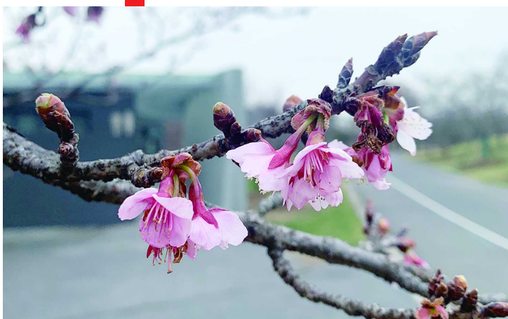
寒樱的花期非常早，几乎与梅花同期开放，花淡红色，花瓣5枚，伞形花序。

公园里，梅花盛开，寒樱初绽，预示着又一年樱花季即将到来。园方透露，前年新栽了一批“胭脂粉”樱花，去年春天首次开花，今年3月应该算首次在公众面前亮相。