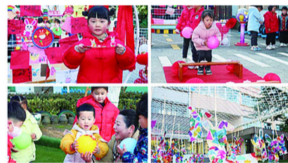
新学期的第一份心愿。这场特别的欢迎仪式承载了老师、家长们的希冀，希望孩子们健康快乐，未来坦途光明。

与此同时，幼儿园还为孩子们筹备了许多精彩的互动游戏和跨栏仪式。神奇的科学游戏让孩子们不禁驻足，一个个开始动手实验，他们用自信、向上的精神风貌接受新学期的新挑战。跨栏仪式象征着孩子们春季开学有一个好的开始，栏杆上写着健康、快乐……孩子们跨过的是一道道栏，收获的是