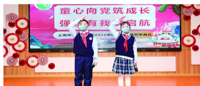
大的梦想，做一名新时代好队员。

■牢记嘱托 立梦远方 五年级的队员分享了《男儿心 中国梦》视频。号召大家要努力学习，从小树立远