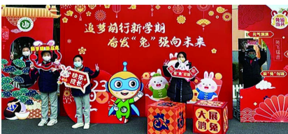
强，传承红色基因，赓续红色血脉！为实现中华民族伟大复兴的中国梦不懈奋斗！

■奋发“兔”强担使命 这个寒假，“江小超”们也搭上了幸福列车，感受欢聚的幸福，见证祖国的变迁与强大。少先队员们更是积极学习党的二十大精神，寻访红色地标。他们激昂的语调、铿锵的话语激励着全体江小学子不忘初心、牢记使命，奋发“兔”