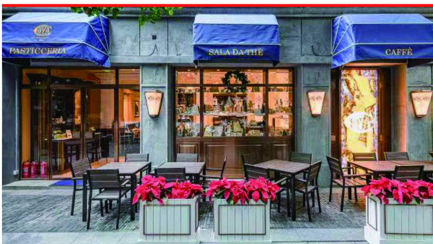
COVA 上海新天地旗舰店