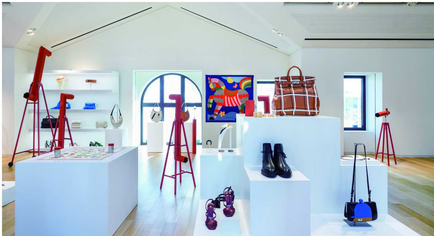
爱马仕 2023 春夏系列预览现场