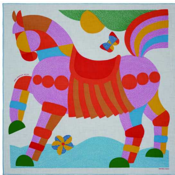
爱马仕羊绒配真丝 “Mon premier galop” 140 厘米披肩