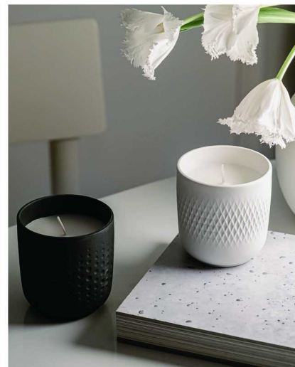
德国唯宝 Ma.Collier | 匠心陶韵系列香薰