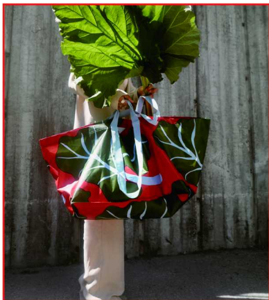
宜家 × Marimekko BASTUA 巴思图限量系列 FRAKTA 弗拉塔手提袋