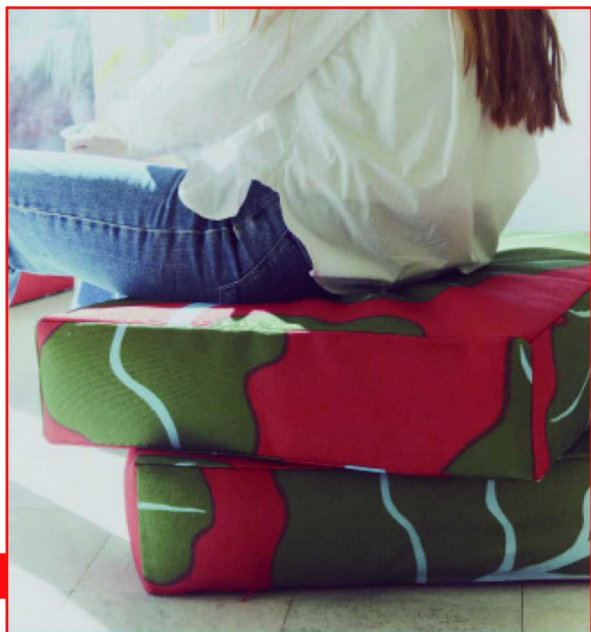
宜家×Marimekko BASTUA 巴思图 限量系列地板垫