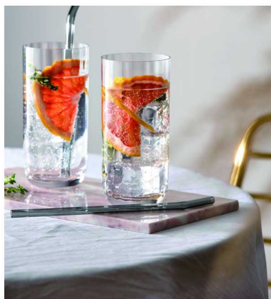
德国唯宝全新 Rose Garden | 玫瑰花园系列水杯