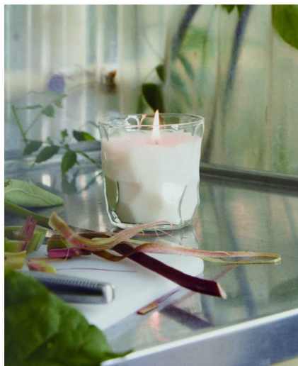
宜家 × Marimekko BASTUA 巴思图限量系列香味烛

气味，是渐入佳境的催化剂。德国唯宝 Ma.Collier | 匠心陶韵系列香薰以黑白为底色，大自然的芬芳馥郁尽凝其中。月华倾泻时，匠心陶韵·白皂的纯净皂香令人感到舒心而温暖，匠心陶韵·花茶的气息则犹如穿越雨后溪边的茶田，充满自然之息。BASTUA 巴思图香味烛带来的则是接骨木花、大黄和甜美香草的香气，令人仿佛置身于清爽畅快的夏日时光。