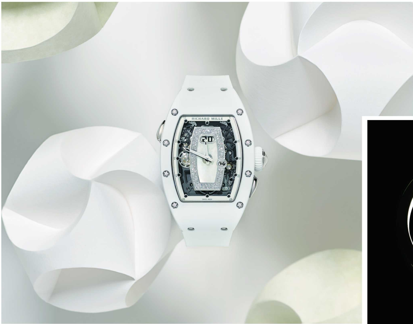
RM 037自动上链腕表肉壳款